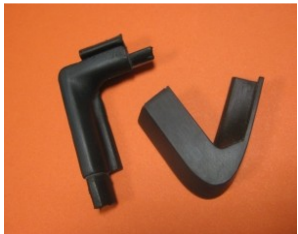
Guarnizioni porta per show car in elastomero