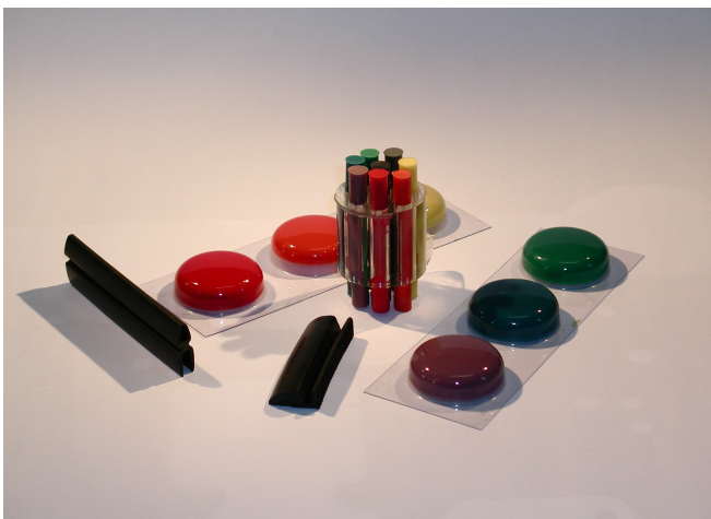
Esempio di provini in elastomero di poliuretano con differenti colorazioni e durezza

In quest'ultimo caso l'impiego di elastomeri di poliuretano offre la possibilità di poter variare le caratteristiche di durezza del particolare stesso potendo così replicare il prototipo in differenti configurazioni che possono variare dai 25 agli 80 Shore A.